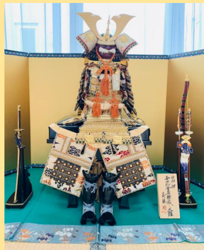
【 鎧兜 】

お世話になっていらっしゃる方より、立派な鎧を寄付して頂きました。施設内に飾らせて頂き、ご利用者様も大変喜ばれています。ありがとうございます。