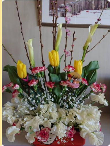
【 フラワーアレンジメント 】

お世話になっていらっしゃる方より、立派な鎧を寄付して頂きました。施設内に飾らせて頂き、ご利用者様も大変喜ばれています。ありがとうございます。