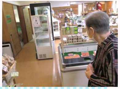
鹿島灘海浜公園と鉾神社へドライブ！

ご家族様からたくさんのお野菜を頂きました。美味しく頂きました。いつもありがとうございます。