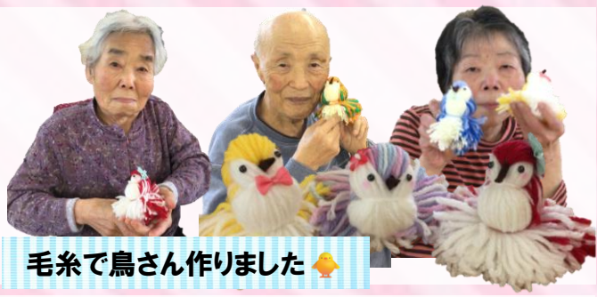
毛糸で鳥さん作りました